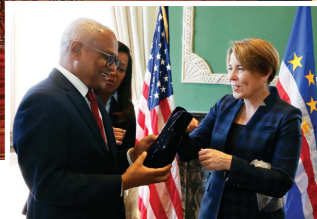
PR convida a Governadora Haley a liderar a visita de uma grande comitiva mista norte-americana a Cabo Verde em 2025

O encontro e a cerimónia de atribuição das insígnias foram antecidos de uma visita ao Museu, momento que ficou registado com uma placa especial alusiva à presença de José Maria Neves.