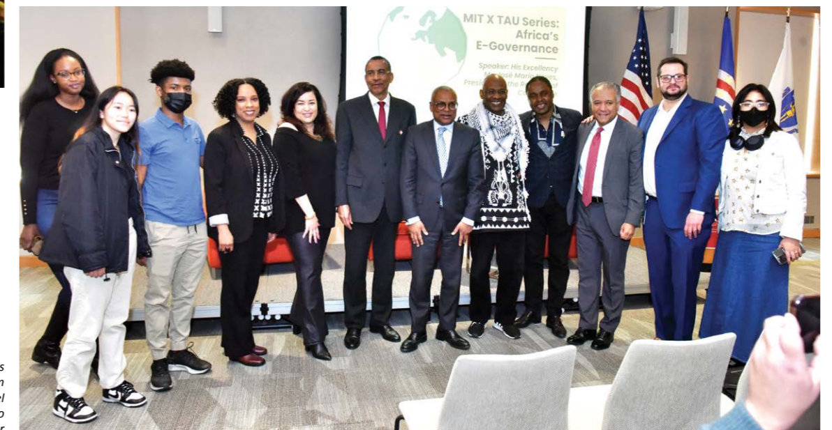
O PR quer mais cooperação com os EUA ao nível da ciência e do ensino superior

Desta visita ficou expresso o interesse das duas partes para uma forte cooperação entre o MIT e Cabo Verde no desenvolvimento de plataformas comuns de trabalho, sobretudo nas áreas da educação, telemedicina e as energias renováveis, e que contribuam para o almejado salto para a transformação digital. O Presidente Neves realça ainda a possibilidade de o nosso país servir como catalisador ainda de outros projetos do MIT na região da CEDEAO.