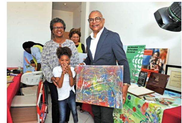
Uma sociedade inclusiva passa, necessariamente, por maior inclusão das pessoas com deficiência, frisa o PR

As comemorações dos 16 anos de atividade da Acarilhar não são apenas uma celebração do trabalho realizado até agora, mas também uma oportunidade para inspirar e mobilizar mais pessoas a se juntarem a essa causa nobre. “É um chamado para que todos abram seus corações e portas, contribuindo com seu tempo, recursos e habilidades para fazer a diferença na vida dessas crianças e jovens especiais”, salienta o PR Neves.