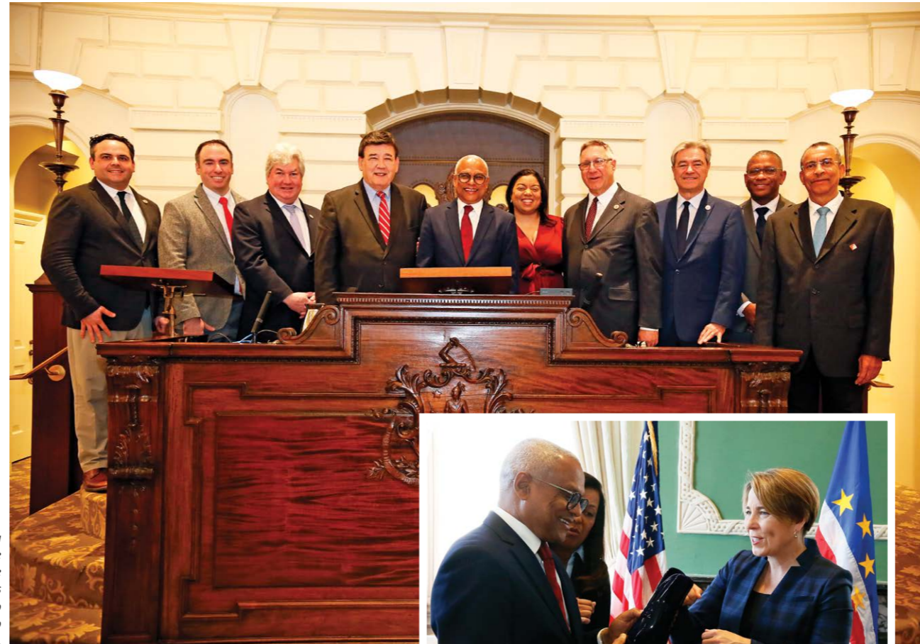
Em visita ao State House de Massachusetts o PR falou ao Senado do Estado.

O Chefe de Estado cabo-verdiano reuniu-se, ainda, com a vice-governadora de Connecticut, Susan Bysiewicz, que esteve