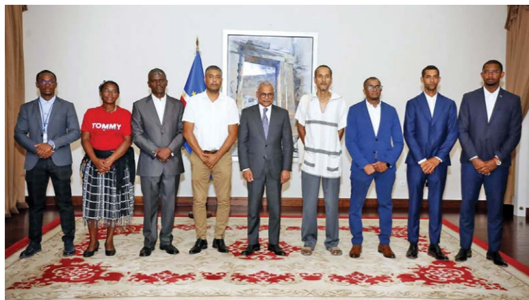
Com essa condecoração o PR quer instigar a maior organização e participação das comunidades para uma cidadania mais ativa

Atualmente, o Clube enfrenta dificuldades acrescidas para materializar seus projetos, precisando de parcerias para continuar a contribuir, com distinção, para a elevação das áreas desportiva e cultural.