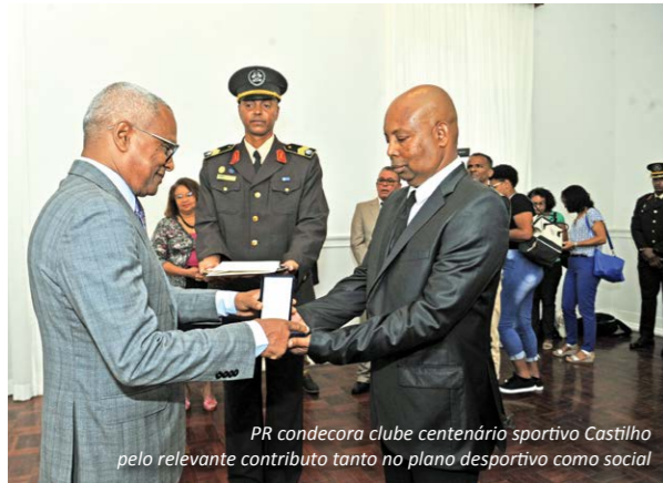
PR condecora clube centenário sportivo Castilho pelo relevante contributo tanto no plano desportivo como social