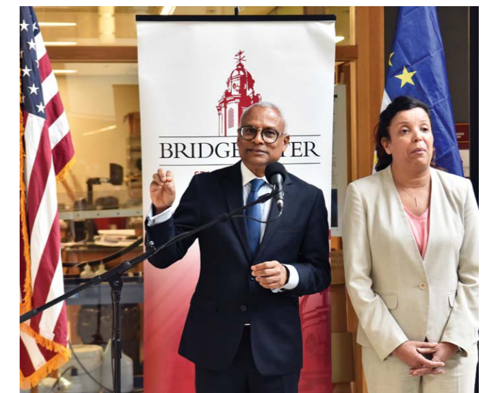
PR encoraja a BSU a continuar a encontrar novas formas de apoiar o desenvolvimento do ensino superior em Cabo Verde

Esta possibilidade vai ao encontro da ideia que o Chefe de Estado tem defendido da criação de uma plataforma, com base nas novas tecnologias de informação e comunicação, que permita identificar, organizar e facilitar o aproveitamento desse vasto leque de conhecimento no seio das nossas comunidades espalhadas pelo mundo, entre académicos, cientistas, especialistas, empresários, empreendedores e profissionais nos mais diversos ramos, potencializando e consolidando a ideia de Cabo Verde, Nação Global.