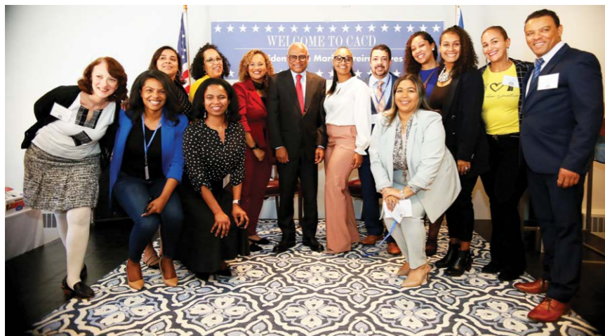
PR em encontro com a Comunidade em Pawtucket